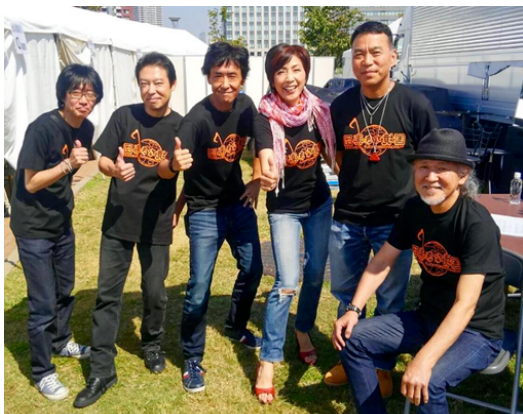
（グローバルフェスタ2018にて楽団Tシャツの理事+α）